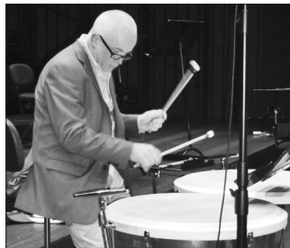
Paukene er av kobber trukket med geiteskinn. Skinnen gir en finere klang enn den man får når det er plast som blir brukt.

mejobb og at det er et stort privilegium å være en del av dette flotte orkesteret. Instrumentet han behersker spiller dessuten en avgjørende rolle både rytmisk og klanglig, understreker han.